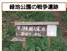
緑地公園の戦争遺跡