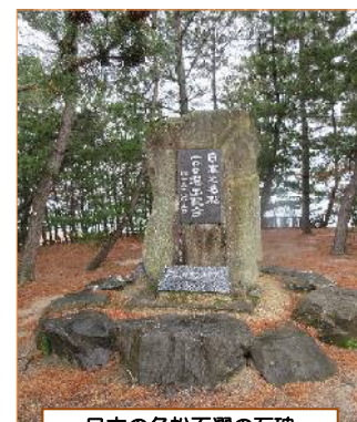
日本の名松百選の石碑