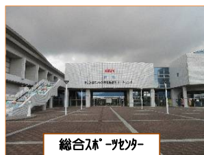
総合体育センター