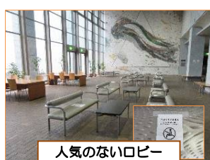
人気のないロビー