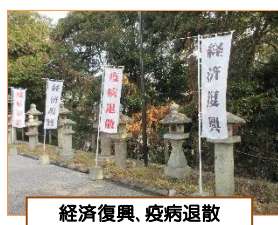
経済復興、疫病退散