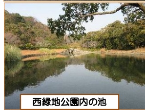
西緑地公園内の池