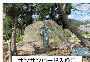
サンサンロード入り口