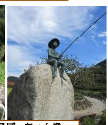
釣りをする坊ちゃん像