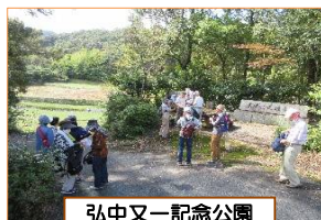
弘中又一記念公園