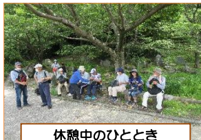
休憩中のひととき