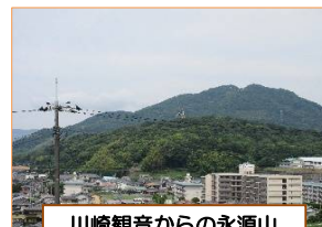
川崎観音からの永源山