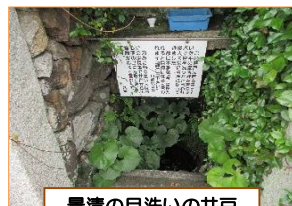
景清の目洗いの井戸