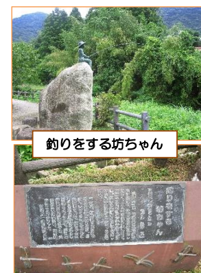
釣りをする坊ちゃん