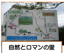
自然とロマンの里