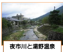
夜市川と湯野温泉