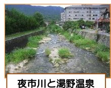
夜市川と湯野温泉