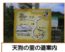
天狗の里の道案内