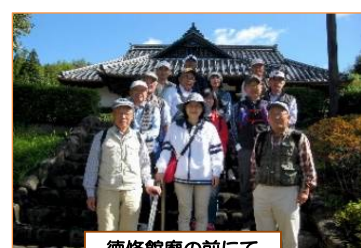
徳修館廟の前にて