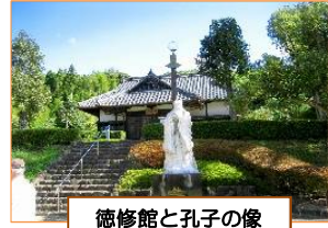
徳修館と孔子の像