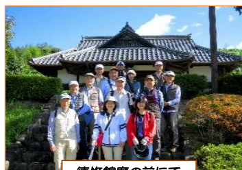
徳修館廟の前にて