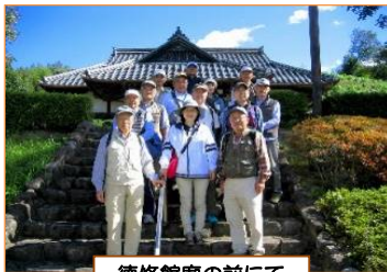
徳修館廟の前にて