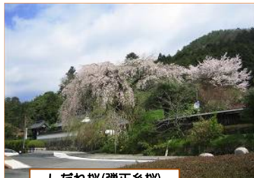
しだれ桜(弾正系桜)