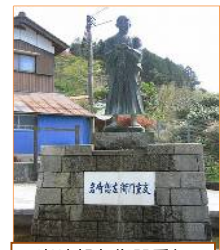
岩崎想左衛門重友