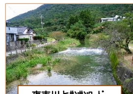
夜市川とサカサカ