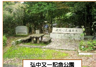
弘中又一記念公園