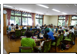
豊鹿里パークで昼食